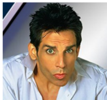
Espressione “Blue Steel”

Make Up: agli albori della sua carriera ha imparato a truccarsi da solo, ora è in grado di camuffare chiunque alla perfezione usando solo un fard ed un rossetto.