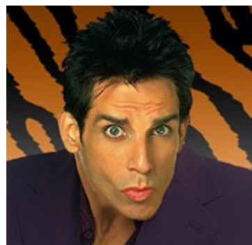
Espressione “Le Tigre”